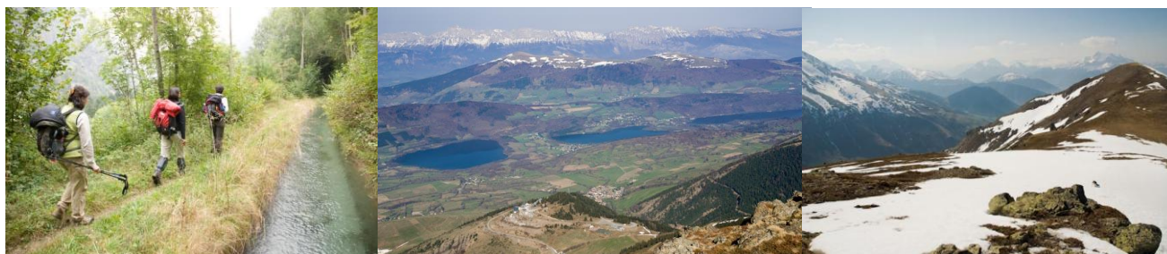
Canal de Beaumont (Valjouffrey) Plateau Matheysin depuis le Piquet de Nantes Contreforts des Ecrins en avril

Voyage en pays montagnards, des Préalpes au Parc des Ecrins